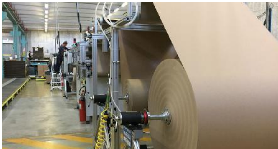
Un reparto produttivo dello stabilimento del Gruppo Grifal a Cologno al Serio (De Pascale)

Un numero in particolare offre un'immagine della dimensione dell'impegno dello stabilimento bergamasco di Cologno al Serio: ha subito un deciso ampliamento, aggiungendo 6.700 metri quadrati ai 14 mila precedenti per fare posto all'intero reparto produttivo di "cArtù", il cartone ondulato ecosostenibile, diventato riferimento della produzione. Da qui in gran parte della crescita delle vendite deriva da qui: